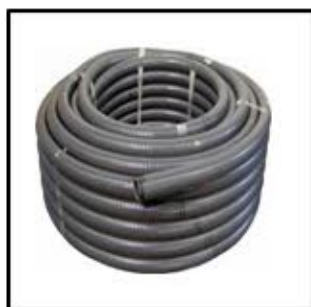
TUBERIA PVC FLEXIBLE