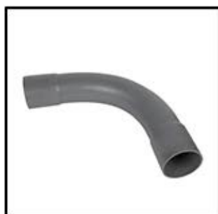
CURVA PVC SAP