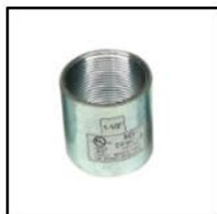
UNION CONDUIT Fe GAL. (IMC)