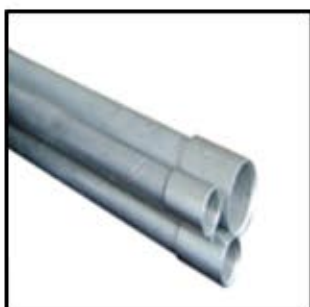
TUBO CONDUIT RÍGIDO C/ ROSCA (PROSTAR)