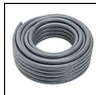
TUBERIA Fe GAL. FLEXIBLE C/FORRO DE PVC (M)