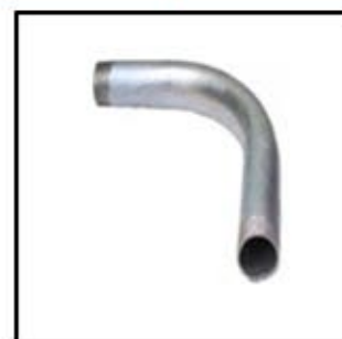
CURVA Fe GAL. CONDUIT