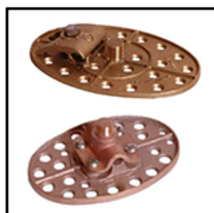
BASE T/AEREO Br Cr OVALADO P/PEGAR FyS