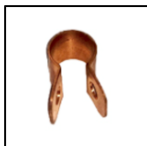
GRAPA D/FIJACION D/COBRE