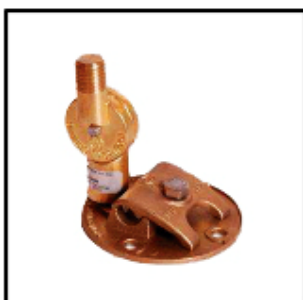
BASE T/AEREO Br Cr C/ADAPTADOR GIRATORIO

BASES PARA CAPTORES AÉREOS EMPLEADOS EN LOS SISTEMAS DE PROTECCIÓN CONTRA EL RAYO