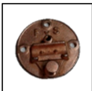
BASE T/AEREO Br Cr CIRCULAR P/TORNILLOS FyS